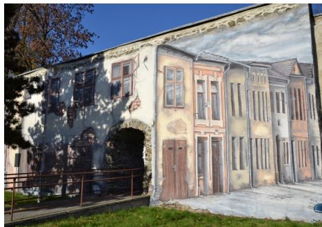
1) Školní ulice