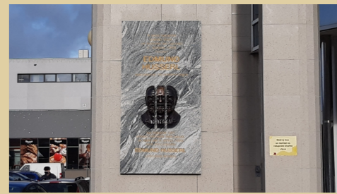
10) Pamětní deska filozofa E. Husserla