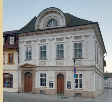
11) Špalíček – Uprkova 12