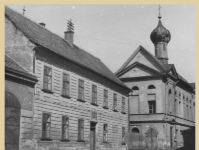
7) Ehrenstammův nadační dům – dnes Odbor dopravy MMPv