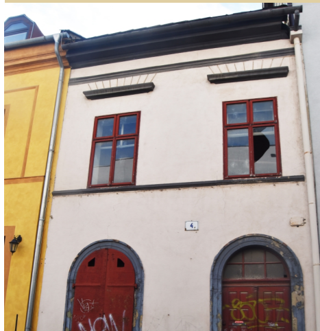
3) Náměstí Sv. Čecha č. 4