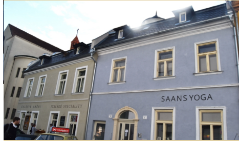
4) Náměstí Sv. Čecha č. 1-2