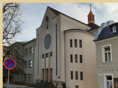
5) Husův sbor (někdejší nová synagoga)