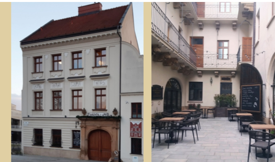
14) Špalíček – Uprkova 20 „Ehrenstammův dům“