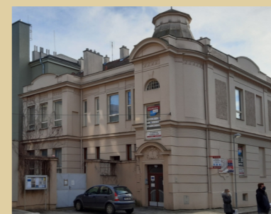
8) Budova někdejšího rabinátu (dnes budova Československé církve husitské)