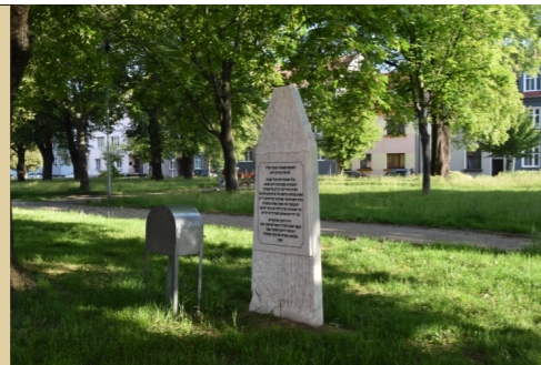
16) Starý židovský hřbitov