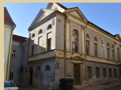
6) Empírová synagoga