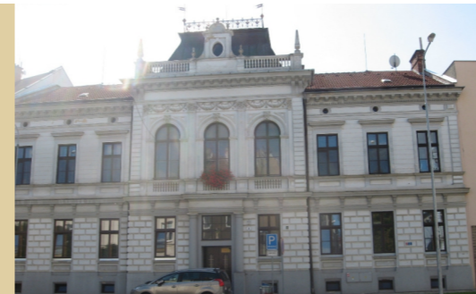
15) Sádky 2 – někdejší nadační dům Gideona Brechera