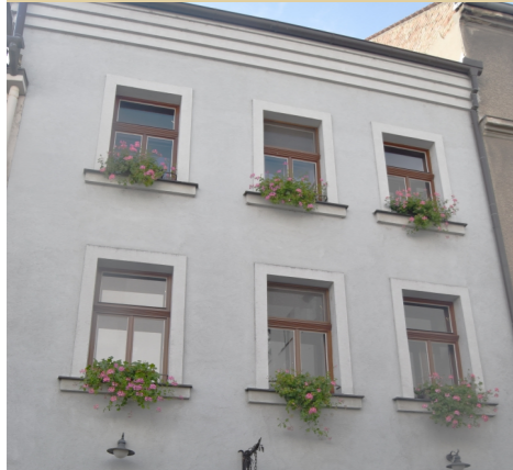
2) Náměstí Sv. Čecha č. 5