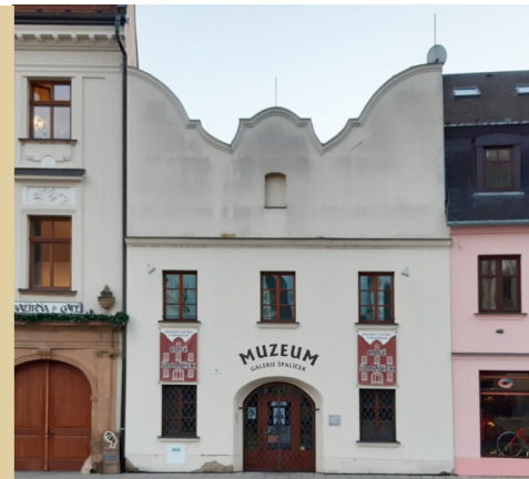
13) Špalíček – Uprkova 18 („vlaštovka“)