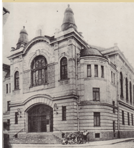
5) Nová synagoga-dnes Husův sbor